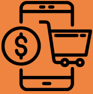
E-Commerce Scam (Variants)