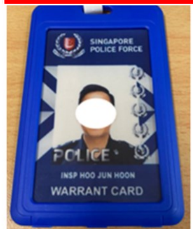
Photo of fake Police warrant card sent to the victim.