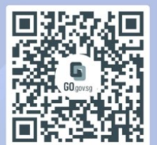
SPF's Anti-Scam Resource Guide Information and relevant FAQs for scam victims

For more information on this scam, visit SPF | News (police.gov.sg)