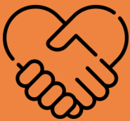
Penipuan Panggilan Kawan Palsu